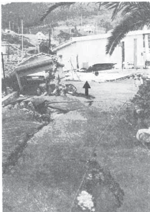
被災した給油所、並路、矢印は到壊した防火堀

援隊に頼らざるを得ない状態が続いており、河津町でも、住民は、ミカン栽培用のビニールハウスに寝泊りして余震に備える、といった状況にあった。私たちの調査隊自体、遭難のおそれさえあったのである。現地人の恐怖ぶりが察しられて余りある。