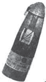
保険付 家庭用万能消火器 ピーナ

本社 大阪市生野区腹見町2の33 TEL (751) 1351 営業所 東京・大阪・仙台・名古屋・福岡 富山・北海道