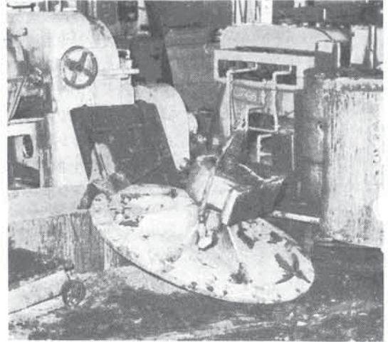
ロール工場に落下したボールミルの蓋

事故原因は、①ボールミルの冷却水の通水忘れ、②静電気説、③異物混入等考えられるが、詳細について目下調査中で、判明次第後日報告する。