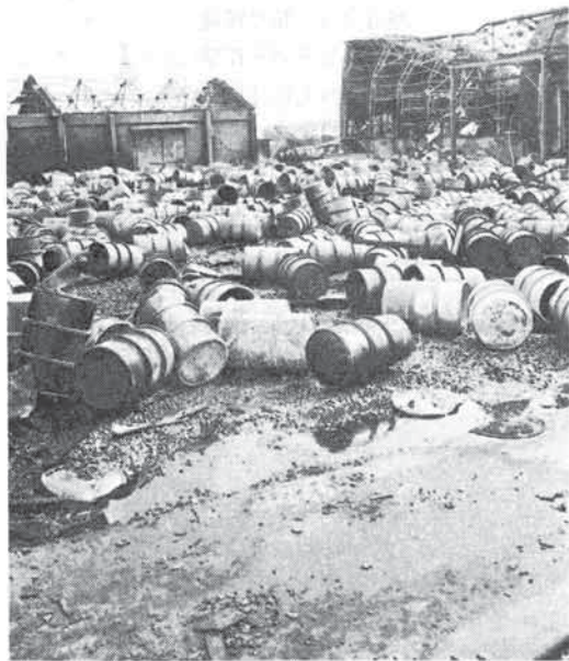
〔写真〕爆発炎上した宝組倉庫、硝化綿のドラム缶が無数に転っている。

火災は爆発を伴って猛威をきわめ消火に手間どったが、その中に木造倉庫に保管されていたパーメックが突如大爆発し、消火活動中の消防職員19人が死亡した。無許可貯蔵のため消防隊もまさか一般倉庫で爆発が起るとは予想もできなかった。会社側より一言指示があればかかる惨事にはならなかったものを悔まれたものである。