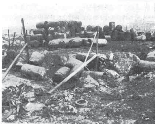
〔写真説明〕破裂炎上した廃油ドラムの山、ドラム鏡板がふくれ、中には裂けているのがみられる。

以前から相当量の廃油が貯蔵取扱われていたため、所轄署よりも屋外貯蔵所を設置する等の合法処理をするよう指導されていたが、その土地が公園予定地でゴタゴタし、無許可、無届で今日に至っていたようである。