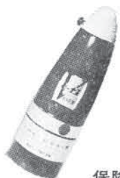
保険付 家庭用万能消火器ピーナス