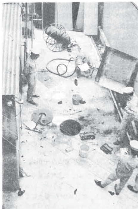
事故現場、作業用工具類や作業者の靴、時計等がマンホール附近にみられる。