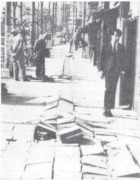
〔下水溝が爆発して破損した歩道〕