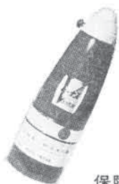
保険付 家庭用万能消火器ピーナス