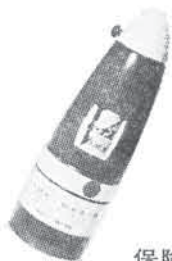
保険付 家庭用万能消火器ピーナス