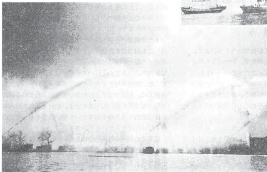
◀寒風をついで淀川畔に展開する水竜の舞、高能機械陣の威容