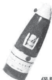
保険付 家庭用万能消火器ピーナス