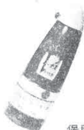
保険付 家庭用万能消火器ピナス