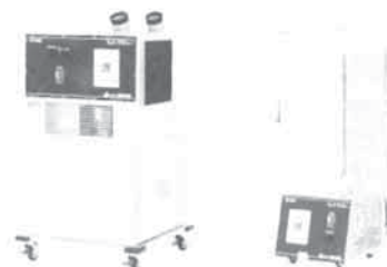
防爆スポットクーラー