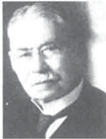
サムエル・ウルマン

「青春とは怯懦（きょうだ-臆病で意志の弱い様子）を退ける勇気、安易を振り捨てる冒険心を意味する。時には、20歳の青年よりも60歳の人に青春がある。齢をかさねるだけで人は老いない。理想を失うとき初めて老いる。