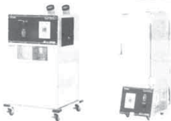
防爆スポットクーラー