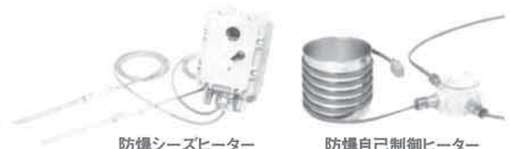
防爆シースヒーター

危険物倉庫内の第4類危険物の低温保管、また反応活性を抑え冷蔵保管が必要な引火性試薬の保管に施錠機能付防爆冷蔵庫。