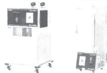
防爆スポットクーラー