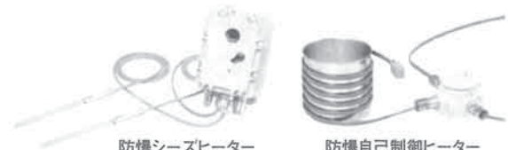
防爆シースヒーター

危険物倉庫内の第4類危険物の低温保管、また反応活性を抑え冷暗保管が必要な引火性試薬の保管に施設機能付防爆冷蔵庫。