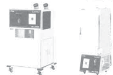
防爆スポットクーラー 防爆冷凍冷蔵庫 DGFシリーズ(150ℓ～)