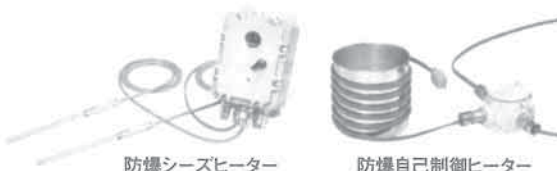
防爆シーズヒーター

危険物倉庫内の第4類危険物の低温保管、また反応活性を抑え冷蔵保管が必要な引火性試薬の保管に施設機能付防爆冷蔵庫。