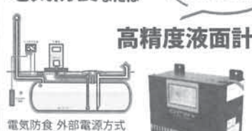
高精度液面計 Site Sentinel