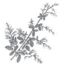
ハギ 花言葉 誠実

の一層の努力を期待したい。最近、活断層の調査研究で著名な寒川旭氏 サンガワアキラ の講演を関西大学 (高槻) で聞いた。50 名の予定が 250 名を超え、高槻有馬構造線に対する質問が集中した。地震は備えあれば憂いなしではなく、備えあってもなお不安が残る、天災は忘れた間にやってくる。南海トラフ地震への減災に絶えまめる努力を。