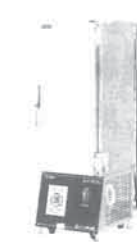
防爆冷凍冷蔵庫 DGFシリーズ (150ℓ〜)