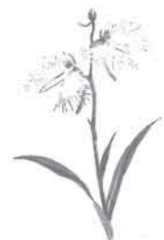
サギソウ 花言葉 心の強さ

どんなに優れたシステムであっても有効に活用しなければ宝の持ち腐れである。優れたシステムを作ったから、良い結果が出ると思うことは錯覚だ。得られた情報を分析して生かすのは、人である。今回の教訓を、重大爆発事故のクライシス・コミュニケーションの充実に生かさねば。