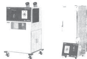
防爆スポットクーラー