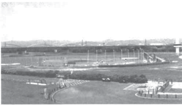
枚方大橋 淀川左岸・砂入り人工芝野球場