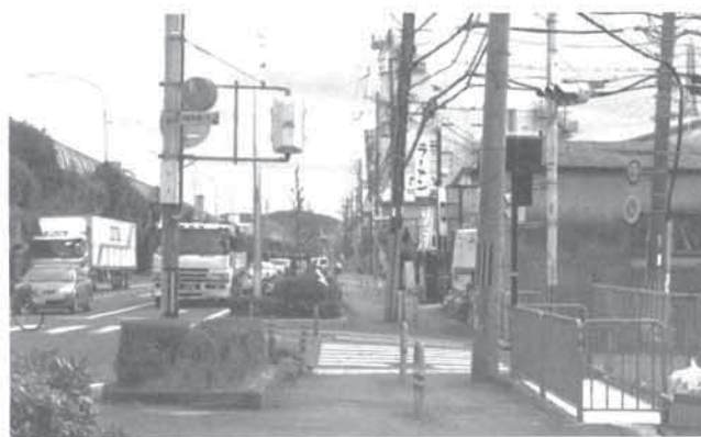
R 171 名神側道西側電柱（京都府長岡京市神足）

まず、日常的な行動範囲の中で傾いた電柱を見つけ、場所が特定できるように撮影します。同時に、他の危険因子である落下しそうな商店街の看板や、倒れる可能性