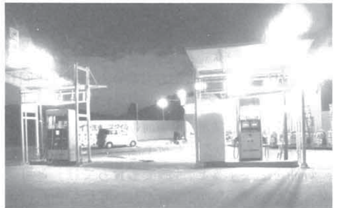
(H 24 / 7 / 31 撮影)

今だから云えるが、当時は余震も数多くあり、明日のことなど考える余裕もなく、無我夢中で店を開けて「もがいて、もがいて」苦しみ、何も見えていない状態でした。