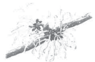
マンサク 花言葉 直感

今回の事故は、想定外によるものではなく、想定内の事故と捉えるべきである。事故の教訓を生かし、重合反応プロセスも含めた安全の再構築を。