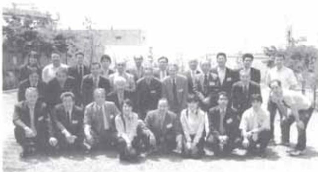
㈱神戸製鋼所「灘浜サイエンススクエア」の視察研修

本協会は、事業所における防火防災思想の向上を図ることを目的とし、昭和25年に発足。以来事業所における火災予防活動を行ってきましたが、近年社会情勢の変化に伴い災害も多岐多様化し、特に危険物施設は一度災害が起こると多大な被害をもたらすことから、危険物施設の保安体制の確立を目的に平成8年10月に危険物品防災委員会を発足し、現在危険物施設を保有する64の事業所が加入しております。