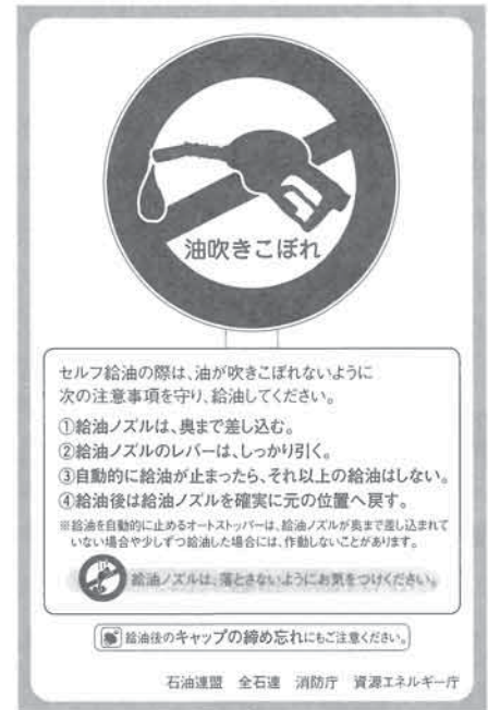
(平成18年度版 消防白書より)

なお、現在消防庁では、学識経験者、行政機関及び関係機関から構成される「セルフガソリンスタンドにおける給油時の安全確保に関する検討会」を開催し、吹きこぼれの原因の把握及び防止対策を検討しており、この検討結果から一層の安全の確保をすることとしています。