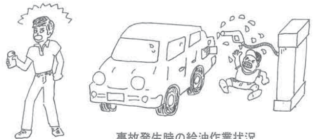
事故発生時の給油作業状況