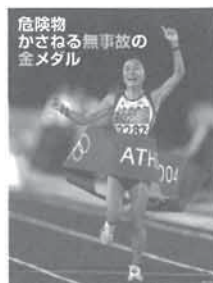
平成17年度危険物安全週間推進ポスター