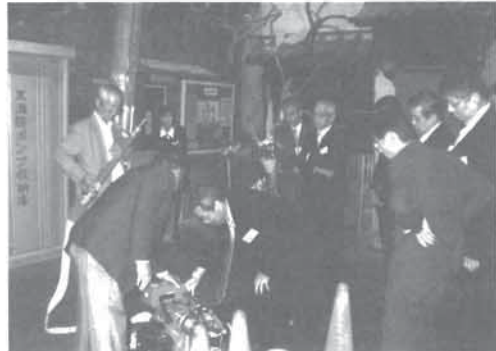
大阪市立阿倍野防災センターで実施された研修会

会員各事業所からも表彰された者の職務遂行上の励みになるとともに事業所の名誉にもなると好評であり、喜ばれています。