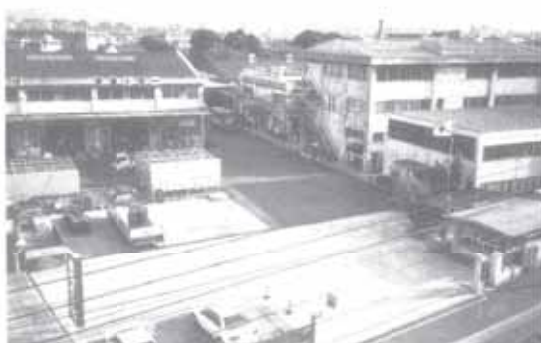
正面から見た同社物流センター