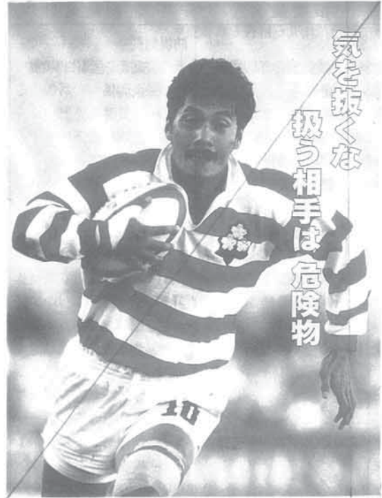
平成9年度 全国危険物安全運動推進ポスター モデル：平尾誠二(元ラグビー日本代表選手、現日本代表監督)

大阪府においては、6月を危険物安全月間と定め、本協会と共催、府下消防長会協賛、(財)消防試験研究センター大阪府支部後援のもと、6月19日、KKRホテルオオサカにおいて安全大会を開催する。