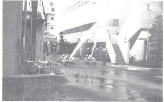
構内で行なわれる放水訓練

また、総合防災訓練に際しては、地元の高槻中消防署からの模範指導を戴き、より機敏で的確な行動ができる様、訓練を積み重ねております。