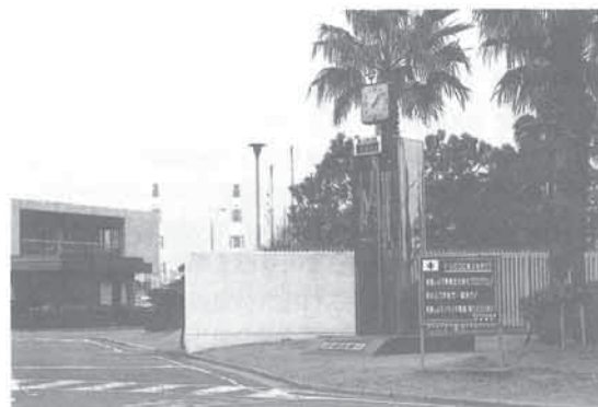
製油所正門前に設置した“安全塔”と製油所重点目標を示す“掲示板”

更に昨年からエクソン社が開発した完璧な操業を目指す「環境安全強化プログラム」を本格的に導入しました。これは安全操業をより高い水準で推進しようとするもので安全や環境に影響を与える業務の全てを新しく開発された基準に照らして評価し、その結果必要に応じ補強や修正を加えたり、新たな施策を追求し改善をはかってゆこうとするものです。