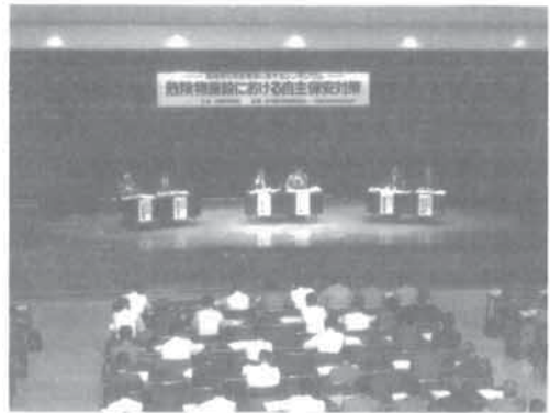
壇上で討議される各パネラーの方々

本日のディスカッションでは、何故、繰り返し事故が発生するのか。また、そうした事故を防ぐためにはどうすれ