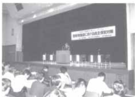
開会の挨拶をされる岡本消防局長

このシンポジウムは、全国危険物安全週間の行事として行なわれたもので、約300名の関係者が参加、14時より岡本大阪市消防局長の開会挨拶につづきパネルディスカッション