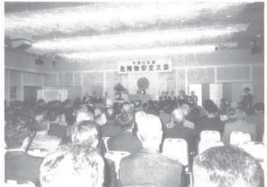
挨拶される岩崎忠夫消防庁次長