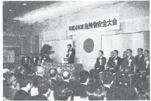
浅野消防庁長官の式辞