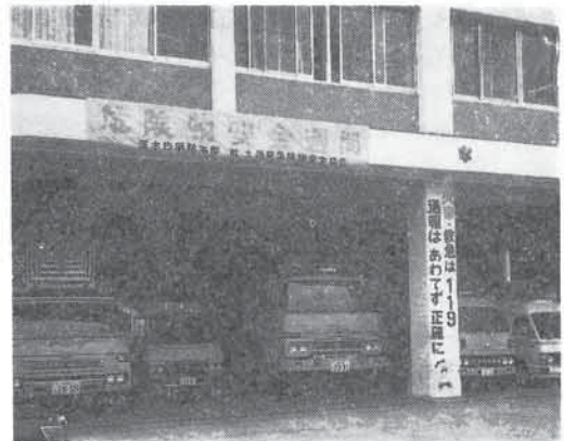
安全週間横断幕を掲げる消防本部

各消防本部や各協会でも各種の行事や危険物施設の消火訓練等が行われ、とくに危険物関係法令の大改正（5月23日）が施行された直後でもあり、研修会等に参加する関係者も、一段とその認識を深めたようである。