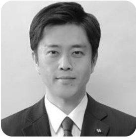
大阪府知事 吉村洋文