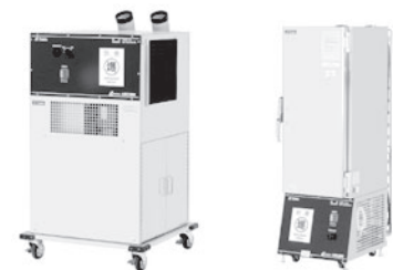
防爆スポットクーラー