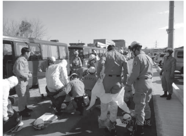
(Jビレッジでの出場準備)

「遅疑 ちぎ すると逡巡 しゆんじゆん するは、指揮者 いまし の戒むるところなり」という教えが消防にはあります。指揮者は、遅れたり迷ったりしているよりも、とにかくその時の最善手を打てということです。これは、災害時に限らず、平素の業務の中での判断にも大いに役立ちます。というよりも、平素の業務を通してベストよりもベターを積み重ねる大切さを体得して、災害のような緊急時に対応できるようにしておくべきものと考えます。