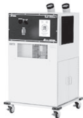
防爆スポットクーラー