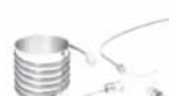
防爆自己制御ヒーター