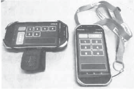
可搬式の制御機器（例）

危険物の規制に関する規則の一部を改正する省令（令和元年総務省令第67号）の公布により、顧客に自ら給油等をさせる給油取扱所（以下「セルフスタンド」という。）において、「可搬式の制御機器」を用いて給油許可等を行うことを可能とする基準が新たに設けられ、令和2年4月1日からその使用が認められました。