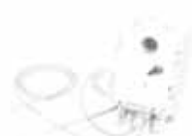
防爆シースヒーター

危険物倉庫内の第4類危険物の低温保管、また反応活性を抑え冷蔵保管が必要な引火性試薬の保管に施設機能付防爆冷蔵庫。