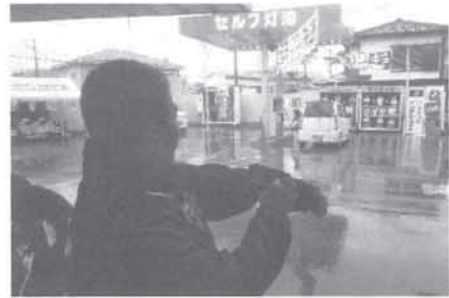
給油許可を行う様子

大阪市消防局では可搬式の制御機器の設置に係る審査基準を定めていますので、設置する場合は管轄する消防署にご相談ください。