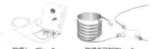
防爆シースヒーター

危険物倉庫内の第4類危険物の低温保管、また反応活性を抑え冷暗保管が必要な引火性試薬の保管に施設機能付防爆冷蔵庫。