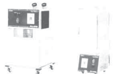
防爆スポットクーラー