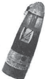
保険付 家庭用万能消火器ピーナス