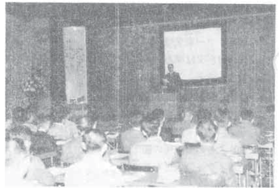
此花区役所での研修

給油所、販売取扱所、移動タンク選任者を10月26日此花区役所、11月2日厚生会館で、製造所、一般取扱所選任者を10月27日此花区役所、11月7日阿倍野区役所で、又貯蔵所関係者を11月8日阿倍野区役所、11月9日市立労働会館で行う。今回の研修者は甲種386名、乙種1,497名である。