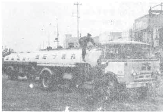
検査をうけるタンクローリー (大正区全国ペイント前で)

なお、大阪市消防局ではこの朝及び各署ごとに独自の街頭検査を実施し、危険物運搬事故の防止につとめている。