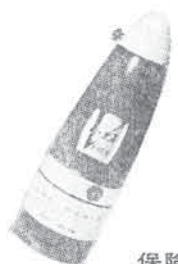
保険付 家庭用万能消火器ビーナス