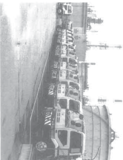
勢揃いしたタンクローリー、奥の一台は24K2車

って安全運転合格者を月間及び年間で表彰し、会社全体の無事故が継続することをねらいとしています。 『スピードDOWN ワナナーUP』くださいあななのやさしさを!! これは、ドライバーから募集した交通事故防止のスローガンの採用作品です。このスローガンはステッカーにして、全タンクローリーの後部に貼っておりませんが、自分自身の心を引き締めると共に、自車の法定速度運転の、後続車へのPRもかねています。